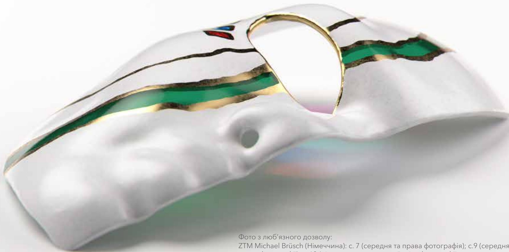
Фото з люб'язного дозволу:

ZTM Michael Brusch (Німеччина): с. 7 (середня та права фотографія); с.9 (середня права та нижня права фотографії); с. 13 (ліва сторона середньої зліва фотографії, верхня права та права сторона нижньої правої фотографії)