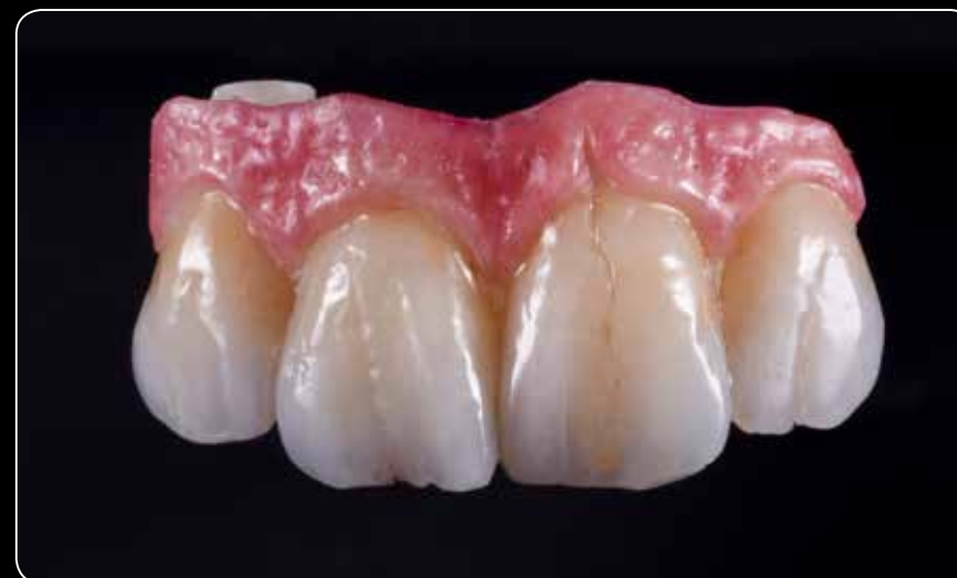
Червона та біла естетика