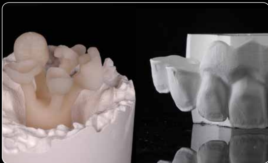
...для усіх ваших цирконієвих та LDS повноанатомічних робіт