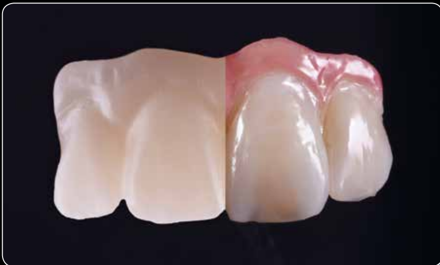
Максимальна естетичність у мікронашаруванні