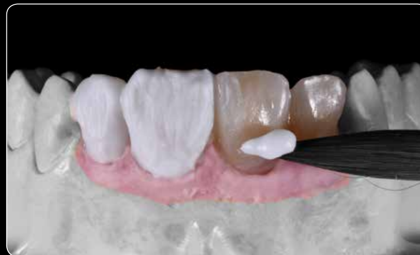
...для технік мікронашарування та розфарбовування