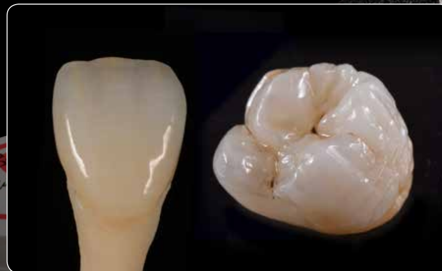
...для фронтальних та жувальних реставрацій